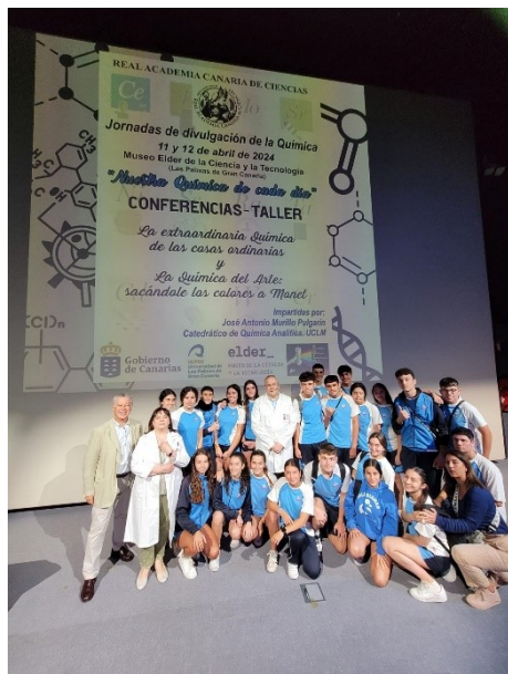
Alumnos de varios centros quisieron fotografiarse con nosotros.