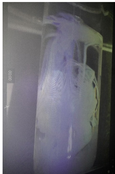
Pigmento blanco de plomo.

Los días 11 y 12 de abril se celebró en la Sala de Proyección Cinematográfica, Cinemax, del MUSEO ELDER DE LA CIENCIA Y LA TECNOLOGÍA de Las Palmas de Gran Canaria, organizada por la REAL ACADEMIA CANARIA DE CIENCIAS, las "Jornadas de divulgación de la Química" sobre "Nuestra Química de cada día".