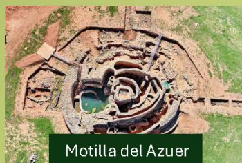
Motilla del Azuer