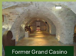
Former Grand Casino